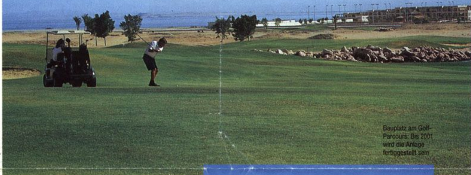
Bauplatz am Golf-Parcours: Bis 2001 wird die Anlage fertiggestellt sein

Keine Fata Morgana am Rande der Wüste, sondern paradiesische Realität, das ist die neue Golfanlage Soma Bay in Ägypten, direkt an der Küste des Roten Meeres.